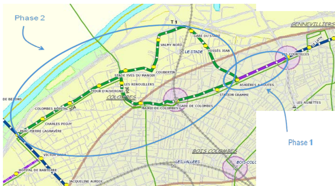
Les tracés à l'étude